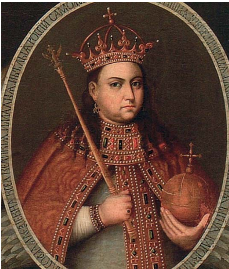
Царевна Софья. Портрет 1680-х гг.