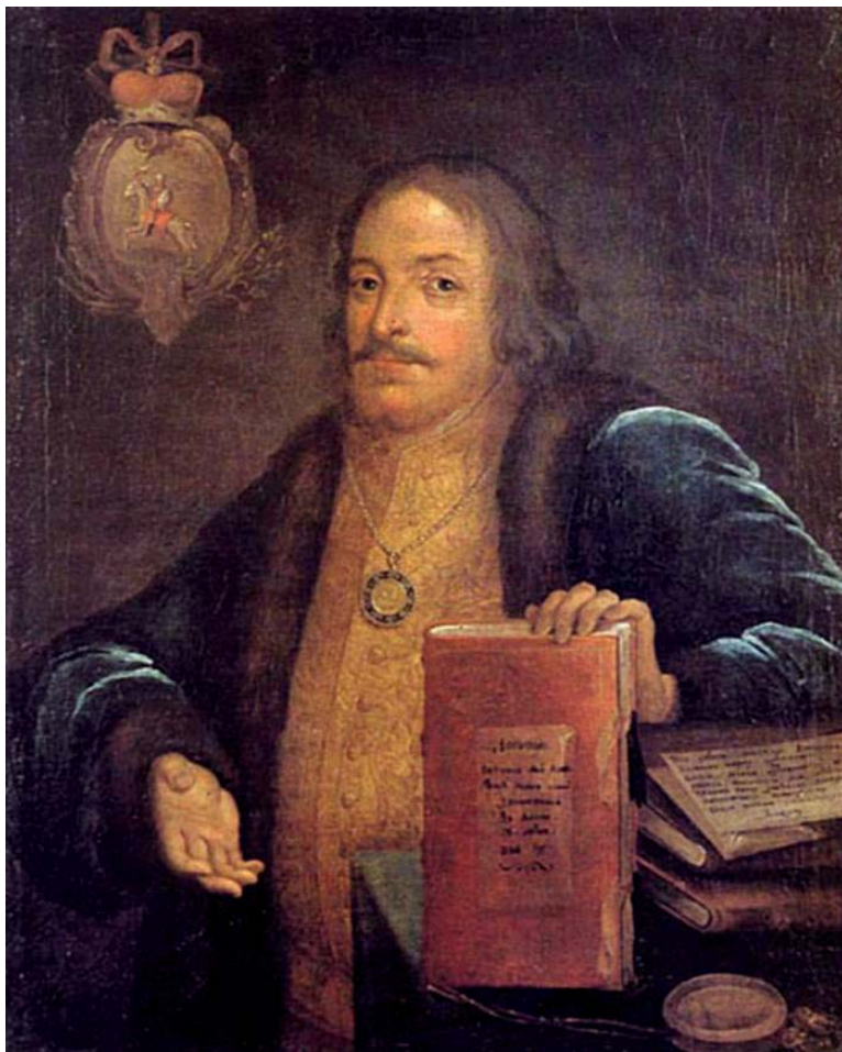
Василий Васильевич Голицын