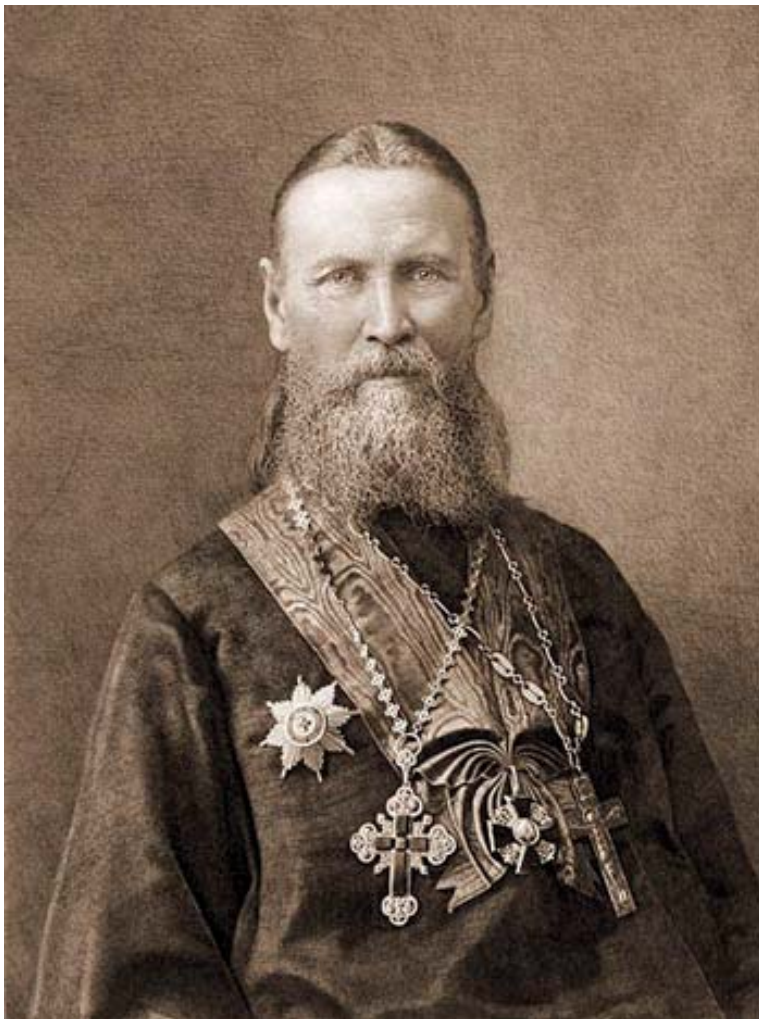
Святой праведный отец Иоанн Кронштадский