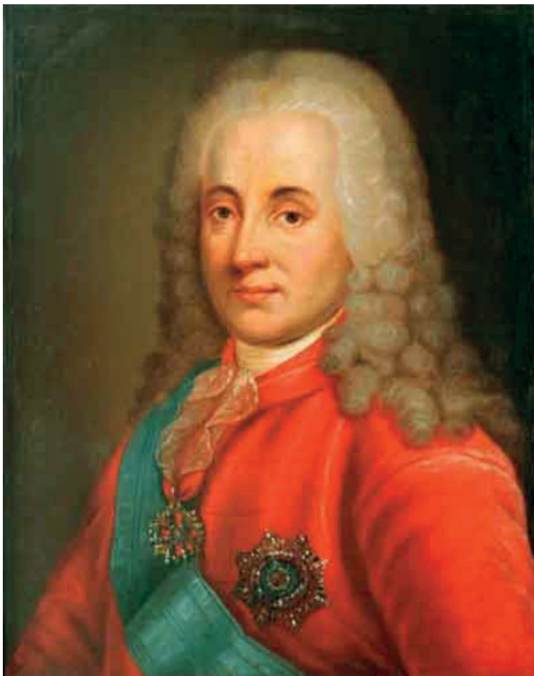
Член Верховного Тайного совета Дмитрий Михайлович Голицын