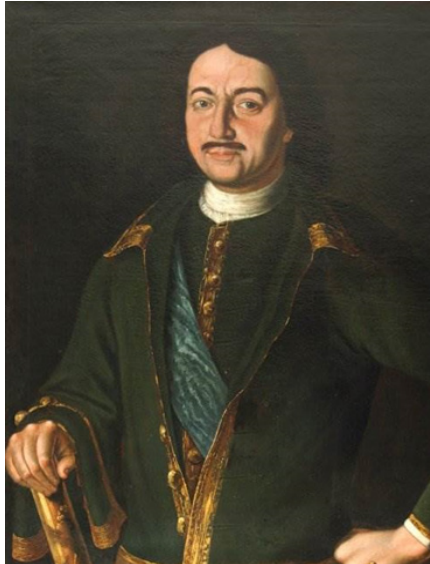
Рокотов Ф. С. Император Петр Великий

Но масоны на своих сходках исполняли «Песнь Петру Великому», написанную Г. Державиным, которая стала их гимном: