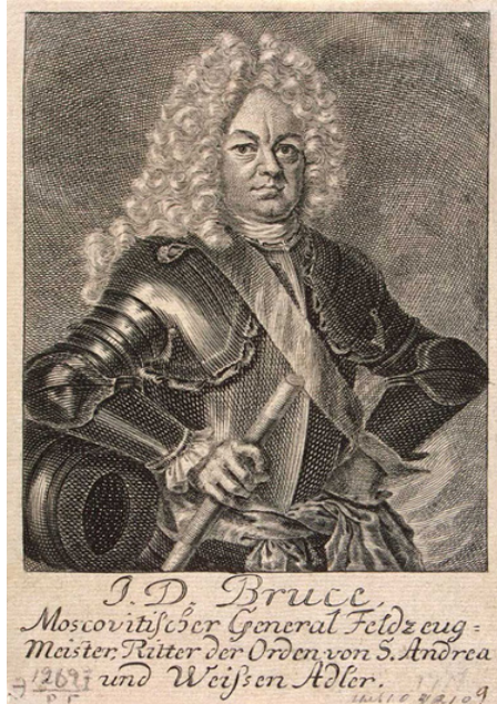
Граф Яков Виллимович Брюс

Генерал-анишефы: Иоганн-Бернгард Вейсбах, позднее — граф, из семьи богемских выходцев; Герман-Иоганн фон Бон, немец; Петр Петрович Ласси, генерал-губернатор балтийских губерний, позднее — фельдмаршал и граф, осужденный на изгнание из Ирландии за приверженность к якобитам; Михаил Афанасьевич Матюшкин, двоюродный племянник царя Алексея; граф Миних, родом из Ольденбурга, генерал-фельдцейхмейстер, генерал-директор <...>, генерал-губернатор Петербурга, вице-президент Военной коллегии <...>; Даниил Павлович Апостол, гетман Малороссии; Язужинский, обер-цталмейстер, а позднее граф, польского происхождения; князь Иван Алексеевич Долгоруков, обер-камергер.