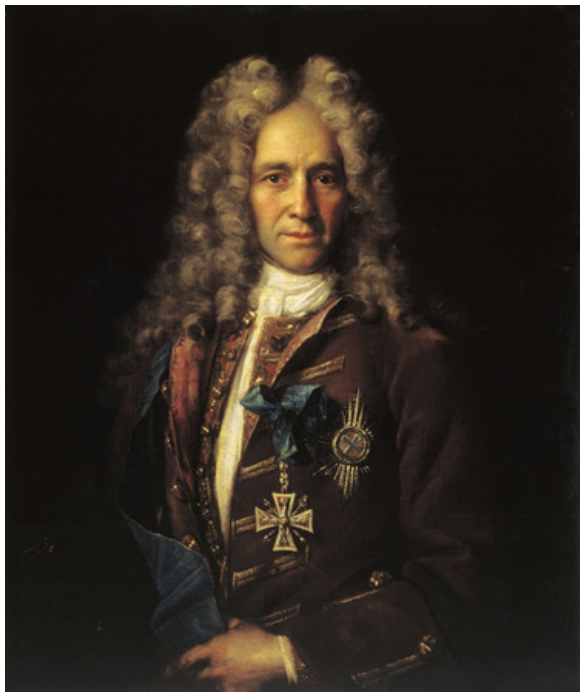
Канцлер империи Гавриил Иванович Головкин

Фельдмаршалы в отставке: Ян Сапега, поляк (вернувшийся к тому времени в Польшу); граф Яков Виллимович Брюс, из семьи шотландских изгнанников, приверженцев якобитов (масонов — С. В.).